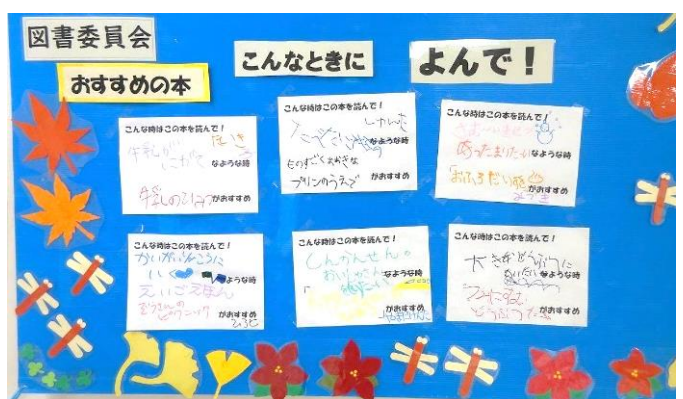
ちゅうがくぶ としよいいんかい せいさく 中学部 図書委員会 制作