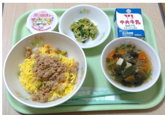
<しゅん やさいをつか ぎょうじしょくれい> 桃の節句献立

がっこうきゅうしょく からだ こころ せいちょう ささ 学校給食は、みなさんの体と心の成長を支え えいよう とどの こんだて るための栄養のバランスが整った献立だけで しゅん やさい くだもの じ ぼさんぶつ しょう なく、旬の野菜や果物、地場産物を使用した きせつかん こんだて と い 季節感のある献立をたくさん取り入れています。 た 食べることで食の知識やマナーを身につけ ぎょうじしょく きょうどしょく とお ち いき しょくぶんか たり、行事食や郷土食を通して地域の食文化 でんとう まな い きょうざい や伝統を学んだりできる「生きた教材」です。